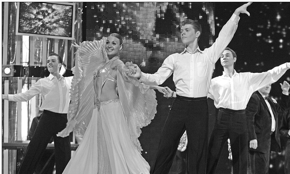
Пластикою та грацією зачарували глядачів студенти кафедри бальної хореографії Київського національного університету культури і мистецтв

У Національному палаці мистецтв ”Україна” 10 травня відбувся концерт Київського національного університету культури і мистецтв ”Мамо, вічна і кохана” приурочений до Міжнародного дня матері. З найкращими піснями для жінок на сцену вийшли Василь Зінкевич, Ніна Матвієнко, Олександр Пономарьов, Надія Шестак, Олександр Серов, Віталій Козловський та Ян Табачник.