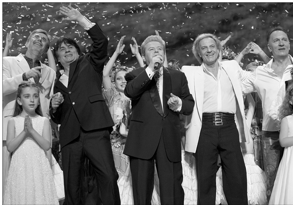
Привітати матерів пісню разом з Михайлом Поплавським на сцену вийшли зірки української естради

Кохати всіх жінок і ставитися до них, як до чогось неземного, закликав усіх чолові-